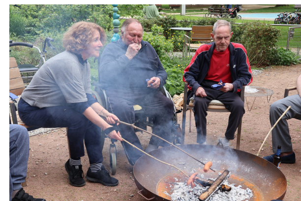
Der Männerclub genießt feine Chlöpfen über der Feuerschale auf der Gartenterrasse.