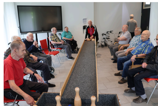
Die Mitglieder des Männerclubs beim Kegeln in gemütlicher Atmosphäre im Sali.