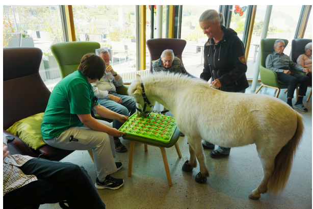
Ein Pony sucht geschickt nach dem versteckten Futter auf dem Futterbrett.

Die beiden sanftmütigen Vierbeiner eroberten die Herzen unserer Gäste auf der Attika im Sturm. Ob beim sanften Streicheln ihres weichen Fells, beim Füttern oder einfach beim Beobachten – die Gegenwart der Tiere weckte Erinnerungen und emotionale Momente.