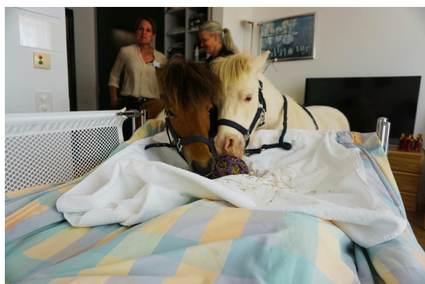
Die beiden Ponys geniessen sichtlich ihre Heumahlzeit direkt am Pflegebett.

Vor einigen Wochen besuchten uns zwei Ponys auf der Attika und sorgten für eine wunderbare Abwechslung im Alltag.