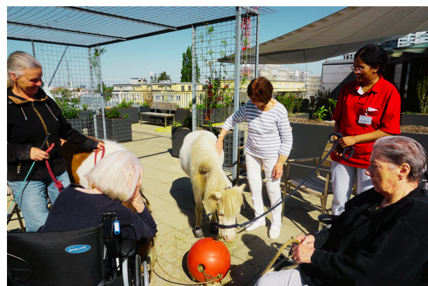
Eines der Ponys schnuppert Höhenluft auf der Dachterrasse.