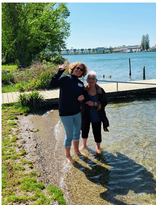
Zu zweit geniesst man die erfrischende Abkühlung und badet gemeinsam die Füße im Rhein.

Der Frühling dringt in unsere Gemüter und erfreut uns bei einem kleinen Ausflug an den Rhein bei Kaiseraugst. Der Campingplatz von Einheimischen liebevoll "Gülle" genannt, ist wunderschön gestaltet und sehr freundlich von jungen Frauen geführt.