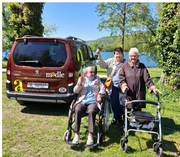
Unser Rollstuhllauto auf dem Campingplatz am Rhein bei Kaiseraugst – bei blauem Himmel geniessen unsere Gäste den Ausflug sichtlich.

Ein Frühlingsausflug führt uns an das idyllische Rheinufer bei Kaiseraugst.