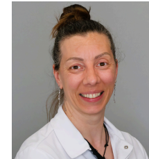
Romy Gerlinger Restaurant 5. Mai 2026