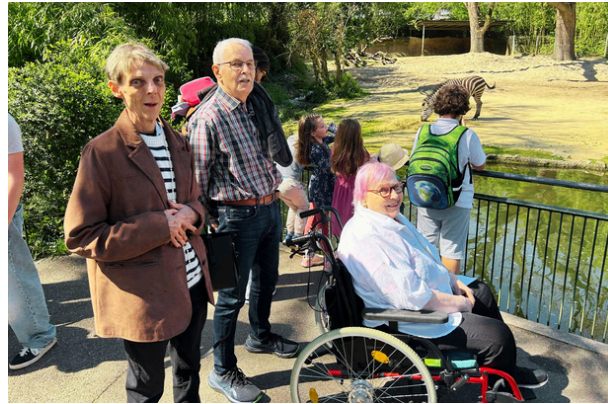
Begegnung mit den Zebras: Unsere Gäste geniessen gemeinsam einen besonderen Moment vor dem Gehege.

Der Ausflug bot viele schöne Momente, Begegnungen und Gespräche. Ein Tag, der in guter Erinnerung bleiben wird.